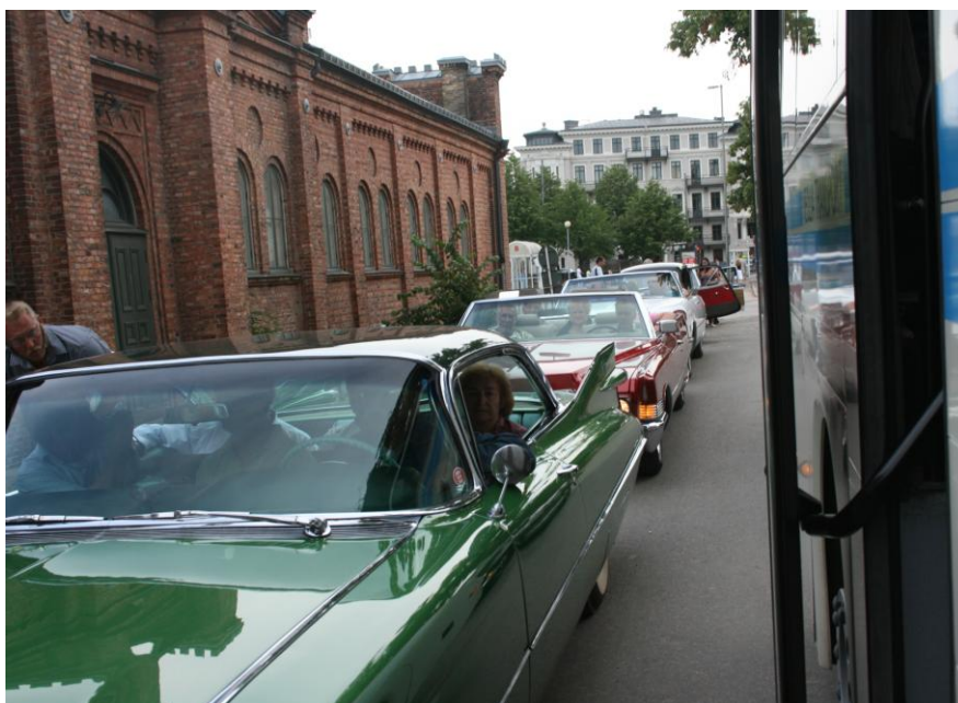
Några av MMK:s fordon som ställde upp vid Gothia Cup:s VIP-träff den 17 juli..

* Rebusjakten, Kul på 2 mc-hjul, 5 september *