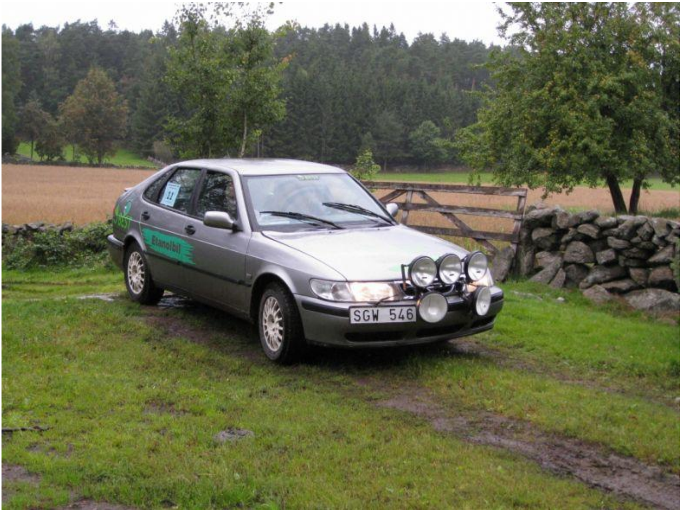
Rolf Linde från Växjö med sin etanol-Saab vid bilorienteringen i Varberg 2008