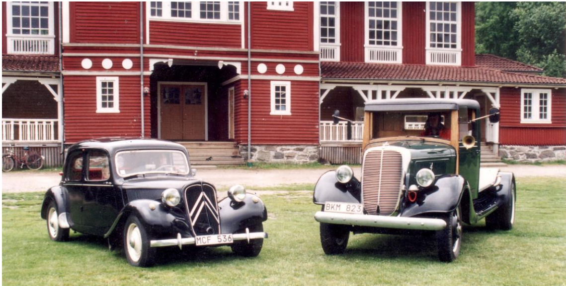
Ingemar Sandahls Citroën B11 sport -52 och Svante Kopps Ford V8 -37.

* Tjolöholm Classic Motor sön 24 maj 2009 *