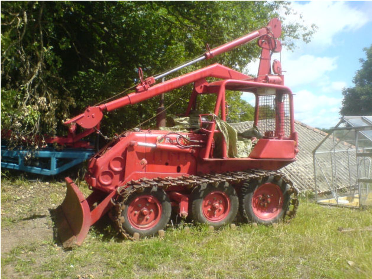
En Bamse. Årsmodell?