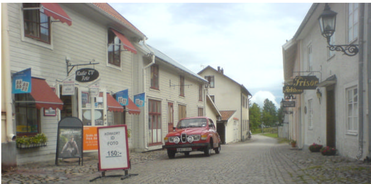
Sommarbild från Gamleby på en fin V4 årsmodell -80, 18 juli 2008