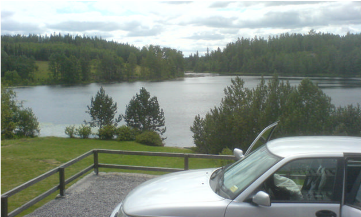
Fin utsikt. Sjö 6 km söder om Dalhem vid Gamleby.