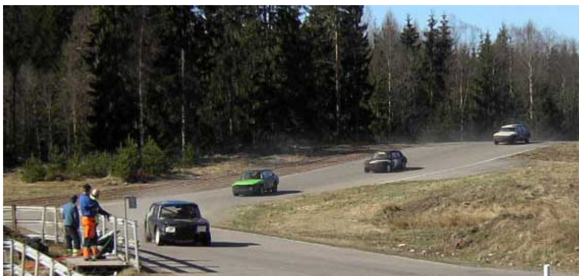
Dalhemscupen 14 april 2007, Borås-banan

Funktionärer skall vara på plats 08:45. Kaffe och varm lunch serveras funktionärerna.