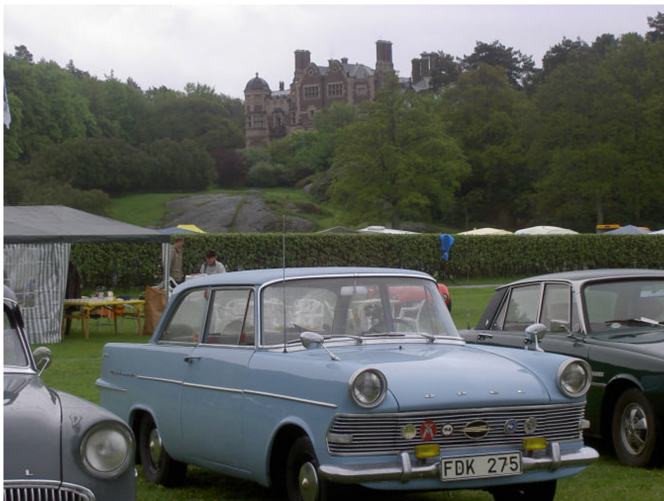
Ulf Perssons Opel Rekord 1700 Coupé -65, Tjolöholm Classic Motor