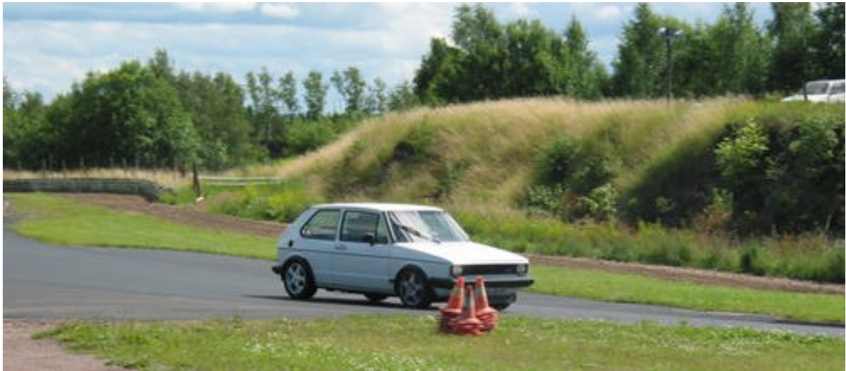
Per Junfors med sin Golf GTi Special, årsmodell 1984

* ÖPPET HUS TISDAGEN DEN 2 OKT. KL 18:30 *