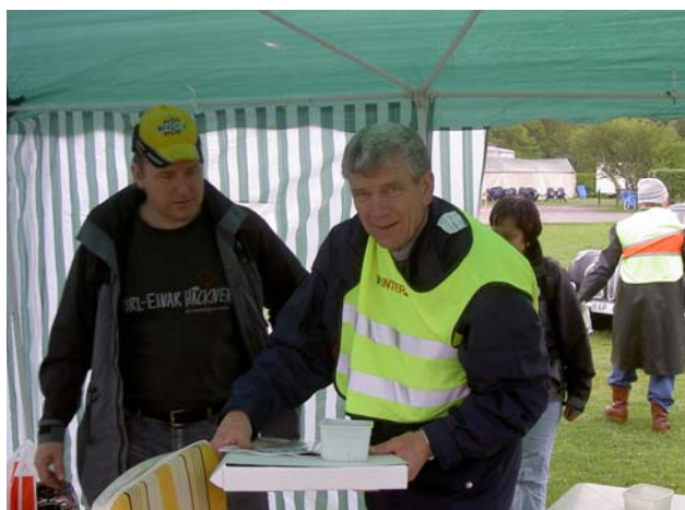
Ingemar och glad funktionär på Tjolöholm 2006.

Nu börjar det bli dags att anmäla sig till Tjolöholm Classic Motor 2007. Årets datum för utställningen är söndagen den 20 maj. SISTA ANMÄLNINGS DAG är 10 april. Både funktionärer och utställare, anmäl er till clas.o.johansson@telia.com eller om ni inte har någon dator, på klubbtelefonen (tel.svarare) 031- 330 64 00. För funktionärer kommer reseersättning att utgå.